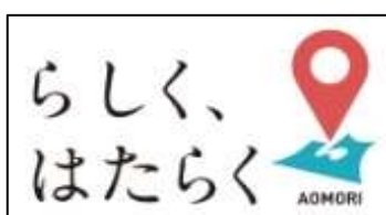
あおもり県内就職促進 パートナー企業