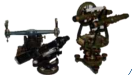
創業当時の測量機器