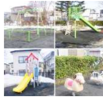
上二ツ堤児童公園外 10公園遊具更新工事