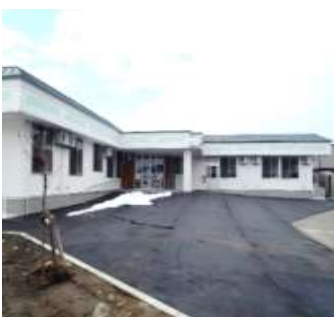
(仮称)生活支援多機能ホールパ インの葺新築、グループホームパ インの森移転改築合築工事