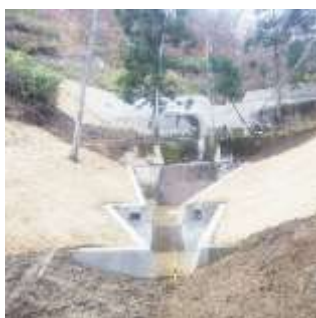
県営予防治山工事