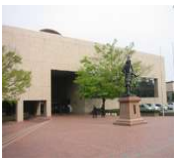
弘前文化センター長寿 命化改修工事