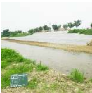
大和沢川河川 災害復旧工事