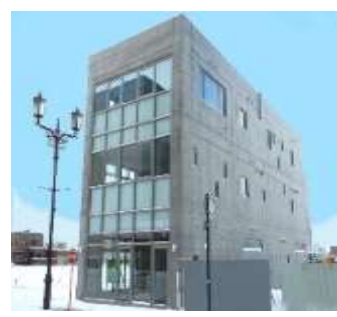
Bam-boo bldg 新築工事