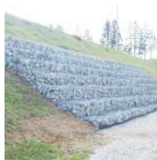
駐屯地構内法面 補修工事