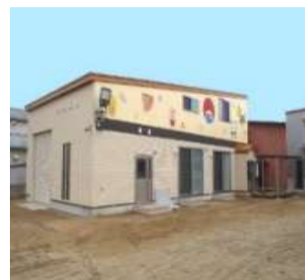
ふじこども園 増築工事