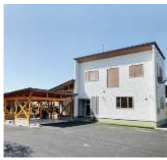
弘前市K様邸 新築工事