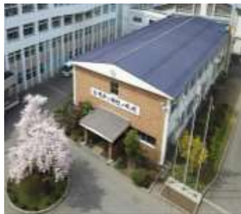
弘前実業高校(管理棟) 長寿命化改修工事