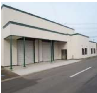
タムラファーム りんご集出荷加工処理 施設新築工事