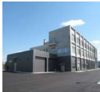
弘前地域研究所 改築工事