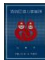
消防団協力事業所